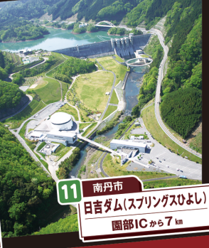
11 南丹市 日吉ダム(スプリングスひよし) 園部ICから7km