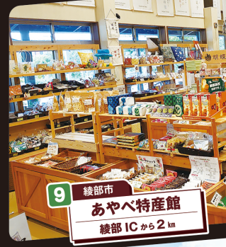
9 綾部市 あやべ特産館 綾部ICから2km