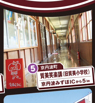
5 京丹波町 質美笑楽講(旧質美小学校) 京丹波みずほICから5km