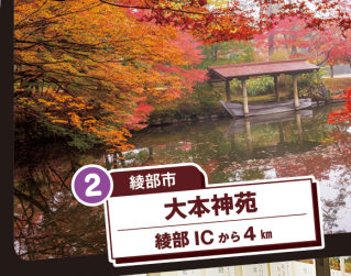
2 綾部市 大本神苑 綾部ICから4km