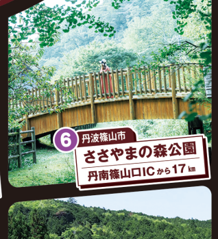
6 丹波篠山市 ささやまの森公園 丹南篠山ICから17km