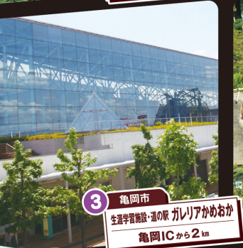
3 亀岡市 生涯学習施設・道の駅 ガレリアかめおか 亀岡ICから2km