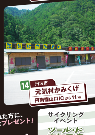
14 丹波市 元気村かみくげ 丹南篠山ICから11km