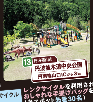
13 丹波篠山市 丹波並木道中央公園 丹南篠山ICから3km