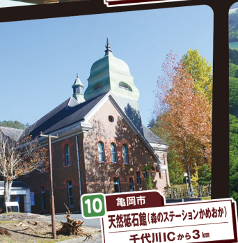
10 亀岡市 天然庵石庵(毒のステーションかめおか) 千代川ICから3km