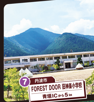
7 丹波市 FOREST DOOR 旧神楽小学校 青垣ICから5km