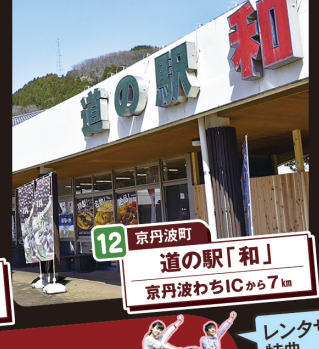
12 京丹波町 道の駅「和」 京丹波わちICから7km