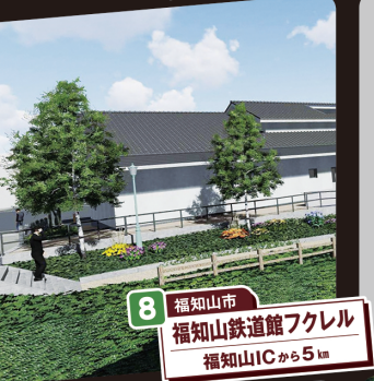
8 福知山市 福知山鉄道館フレクル 福知山ICから5km