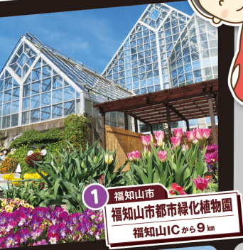
1 福知山市 福知山市都市緑化植物園 福知山ICから9km